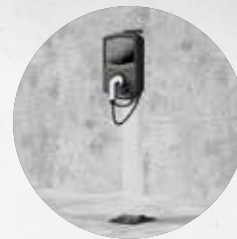
MONTAGE SUR COLONNE AVEC SUPPORT AU SOL